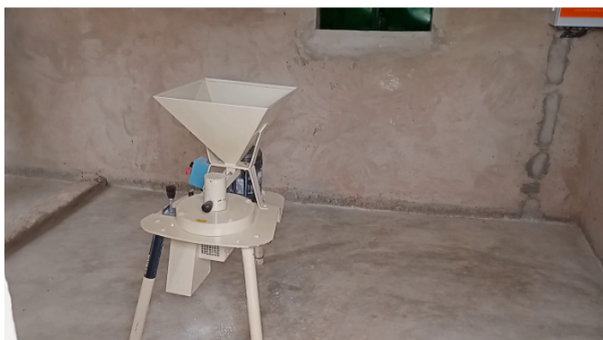
Un des moulins qui fonctionne avec de l'énergie solaire