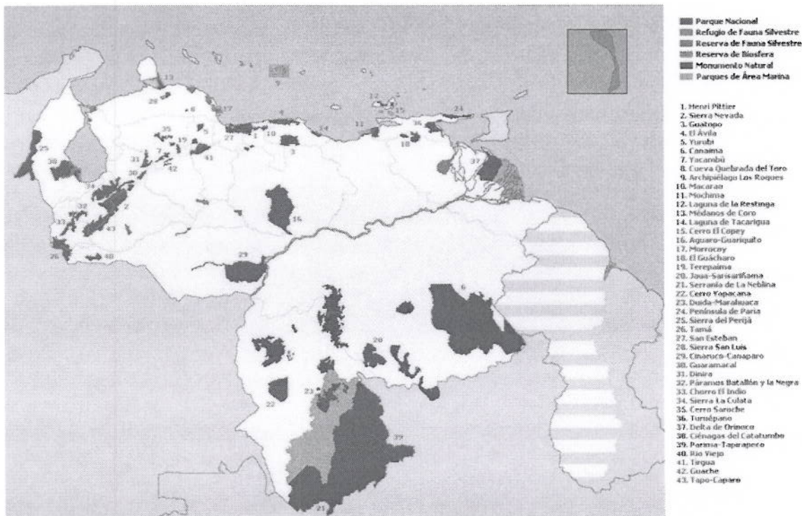
Mapa 1 Áreas Protegidas de Venezuela

El foco geográfico del PPD está centrado con especial énfasis en las áreas protegidas, como se muestra en el mapa a continuación: